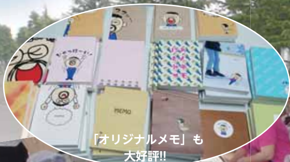
「オリジナルメモ」も 大好評!!