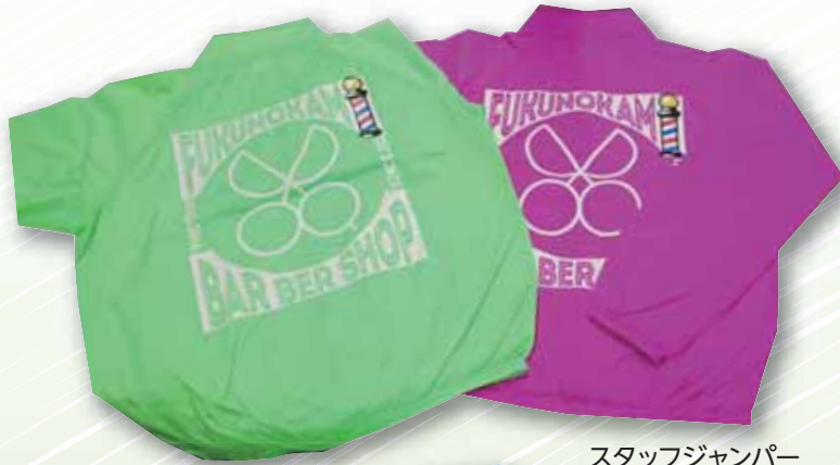
スタッフジャンパー