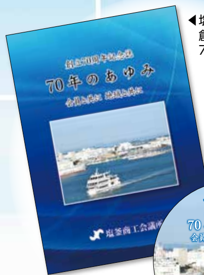
◀塩釜商工会議所 創立70周年記念誌 70年のあゆみ記念DVD

DVDは電子化した本の様なつくりも出来ますし、もちろん映像だっただっぴり入れられます。実はインターネットが繋がっている機器を使えばリンクを張ってホームページへGO！何でも出来ちゃう優れたものです。企画からご相談頂ければ、DVDの機能を最大限に活かしたご提案を致します。小ロットでも受け付けておりますので、気になった方はお気軽にお問い合わせ下さい。