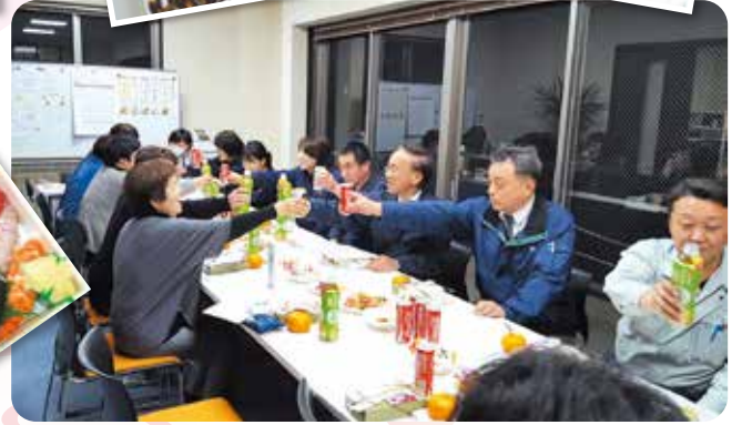
丸長寿司さんのお寿司

仕事納めの28日にキレイになった会議室でお疲れさま会をしました。丸長寿司さんのお寿司とビール、おつまみで、今年1年を振り返り、反省をして締めくくりました。